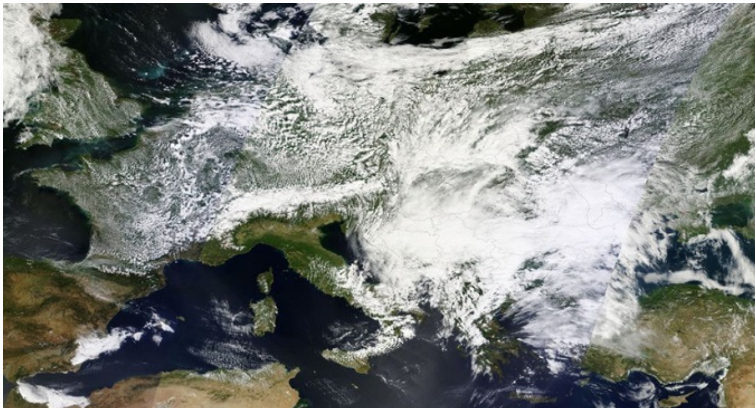
Polje niskog pritiska Tamara (zovu ga i Donat)