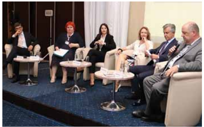
Panel diskusija na temu stanja tržišta u osiguranju na kojoj su učestvovali predstavnici zemalja u regionu