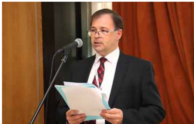
Zlatan Filipović je zvanično otvorio Susrete

ukupnoj premiji u toj zemlji učestvuje sa oko 20 odsto odnosno 73,28 miliona evra, dok je premija neživotnog osiguranja u 2018. iznosila 291 milion evra. Kao što smo rekli primat u portfelju ima AO sa udelom od 51 odsto.