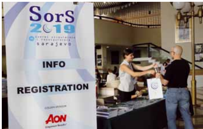
Okupljanje i registracija učesnika